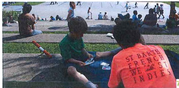
7 FLÂNER ET FAIRE UNE POSE ?

« QU'AIMERIEZ-VOUS FAIRE À PROXIMITÉ DE L'ARANDE, DU CENTRE-VILLE ? »