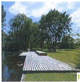
1 DÉCOUVRIR LES RUISSEAUX ?