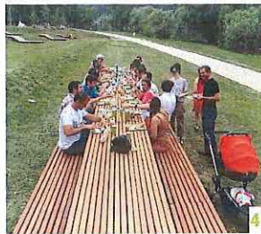
4 SE RETROUVER AUTOUR D'UNE GRANDE TABLÉE ?

« QUAND VOUS AVEZ UN TEMPS D'ATTENTE À L'ARANDE, QUE FAITES-VOUS ? »