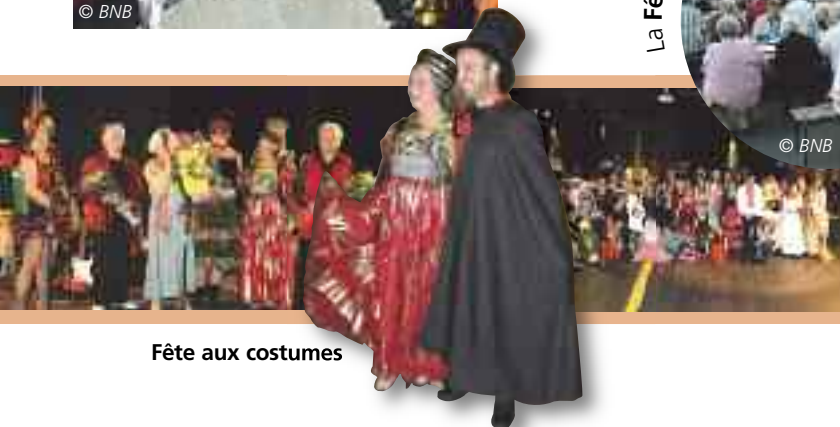
Fête aux costumes

La Fête des bénévoles au Centre de loisirs de Cervonnex