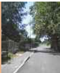
Inauguration de la rue des Chênes