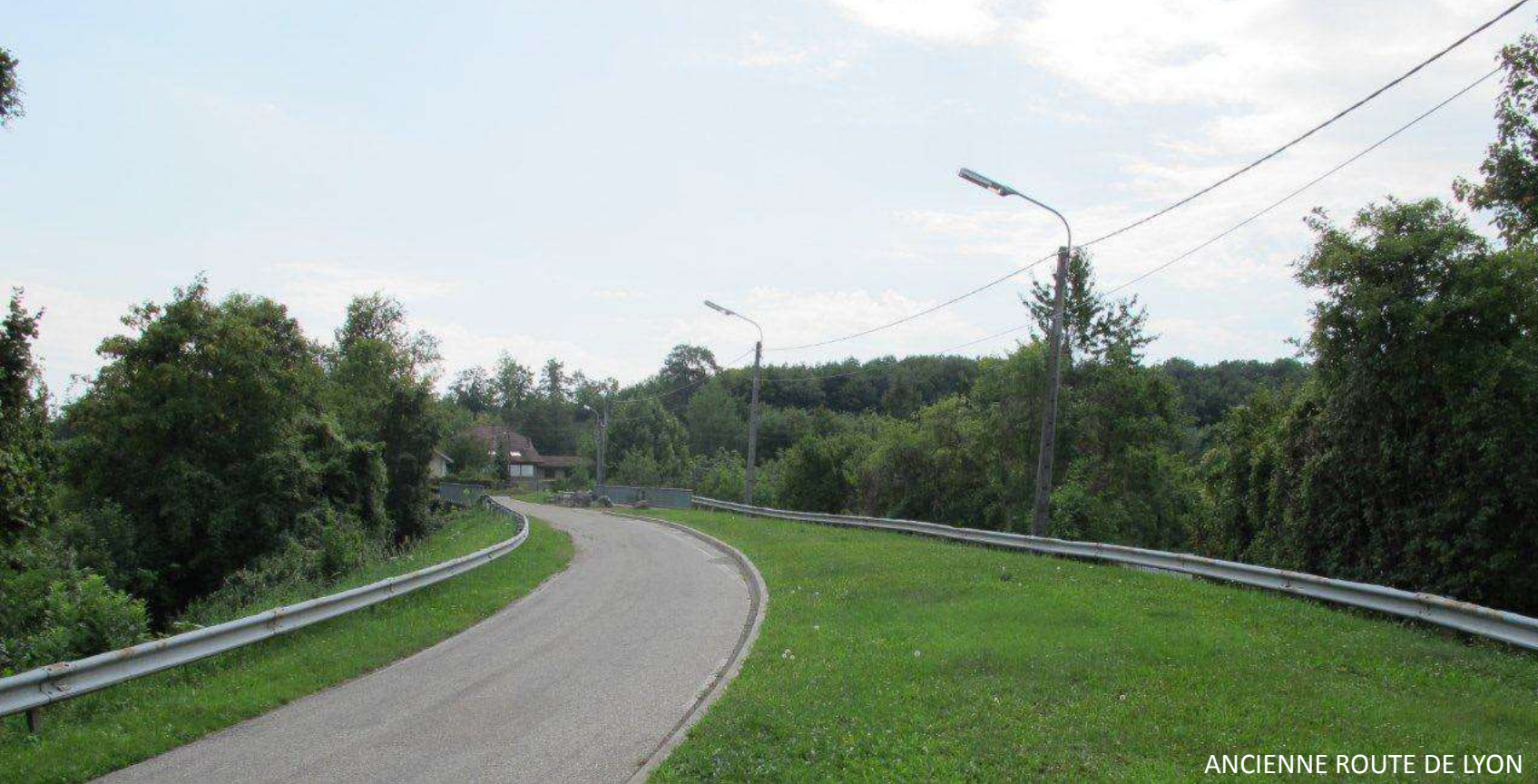
ANCIENNE ROUTE DE LYON